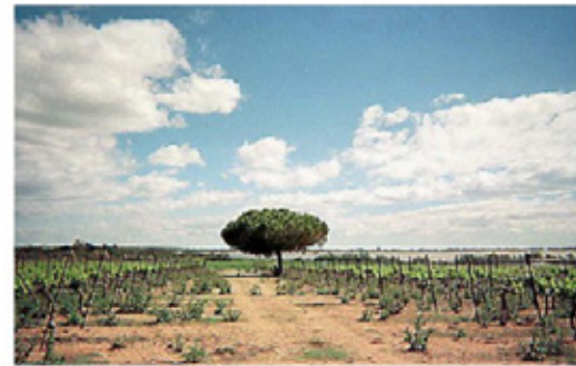
Sofia Boiarchenko a capturé le paysage lagunaire.