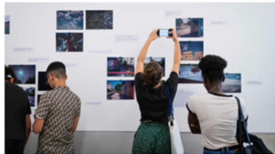
L'exposition "Je voulais capturer la beauté que mes yeux voyaient" est présentée à la médiathèque Pierresvives de Montpellier (Hérault) jusqu'au 27 juillet 2024. (MARIELLE ROSSIGNOL)

Publié le 13/07/2024 18:37 ⌚ Temps de lecture : 3 min